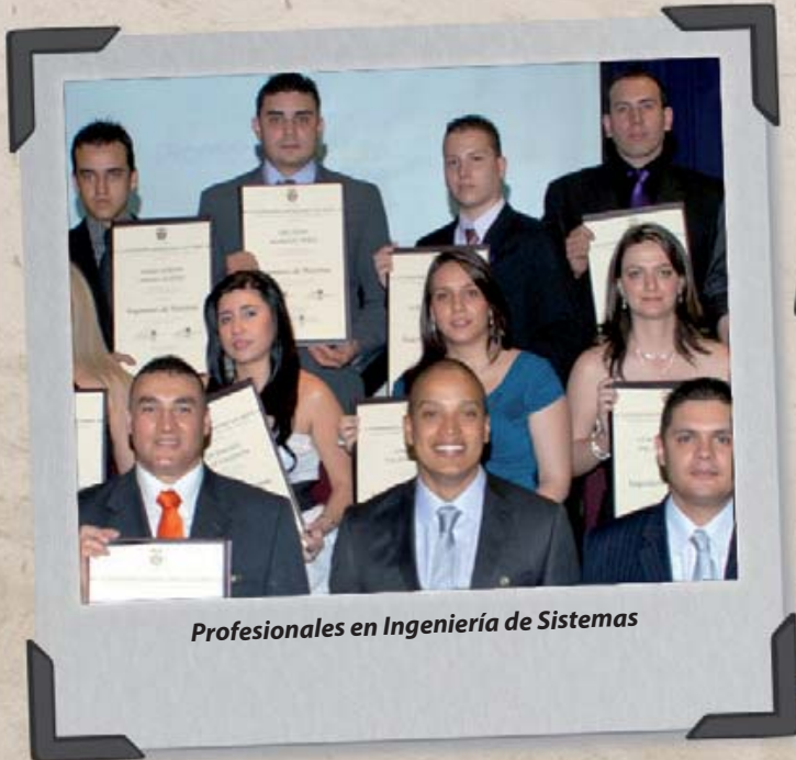
Profesionales en Ingeniería de Sistemas