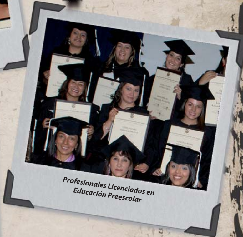
Profesionales Licenciados en Educación Preescolar