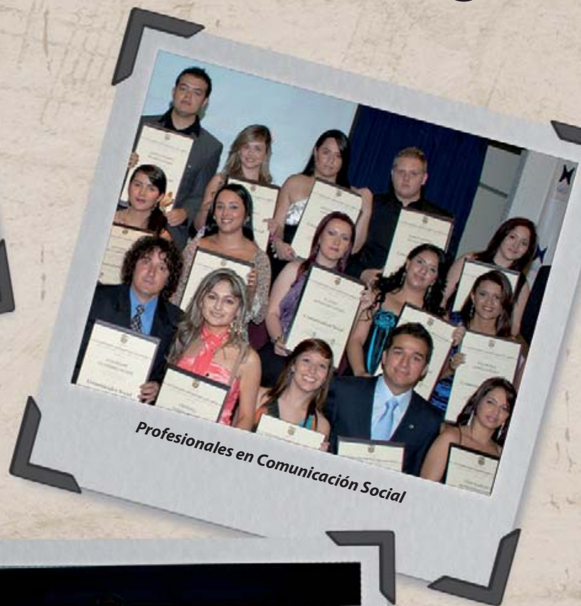
Profesionales en Comunicación Social