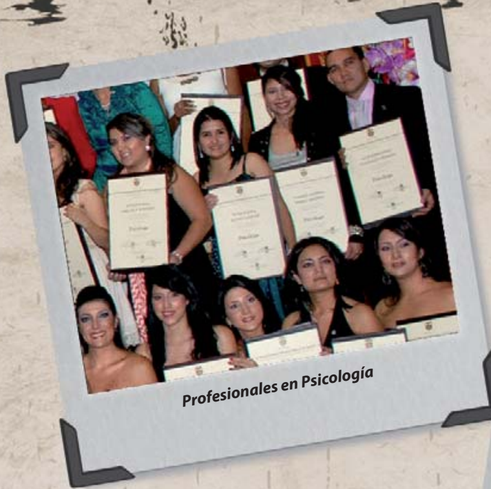
Profesionales en Psicología