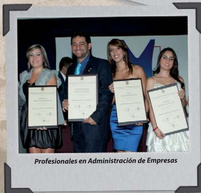
Profesionales en Administración de Empresas