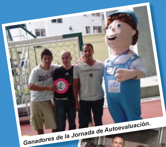
Ganadores de la Jornada de Autoevaluación.

Los ganadores de la Jornada de Autoevaluación fueron tres estudiantes de la Facultad de Ciencias Administrativas, Económicas y Contables.