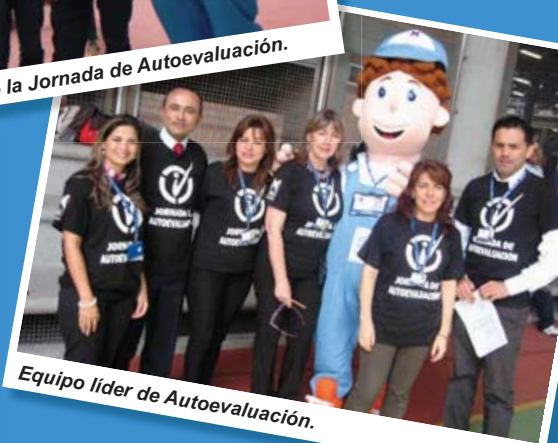
Equipo líder de Autoevaluación.