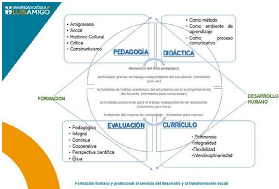
Figura 3. Esquema del Modelo Pedagógico.

esquema, que representa de modo gráfico los referentes centrales que se describen en los siguientes apartados.