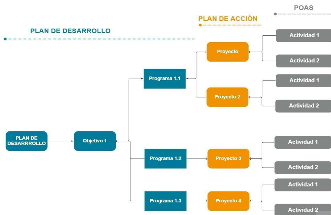
Figura 1. Estructura de la Planeación Estratégica de la Universidad.

El Plan de Desarrollo Institucional 2023-2034 “Formar para Transformar”, es un instrumento formulado de manera colectiva por la comunidad que hace parte de la Universidad Católica Luis Amigó. La elaboración de este documento, es una realidad a las necesidades evidenciadas, luego de analizar diferentes documentaciones, aportes y estudios de posibles realidades futuras en relación con su misión y discusiones dadas en el marco de los eventos realizados para su construcción. El contenido del Plan de Desarrollo Institucional es el siguiente: